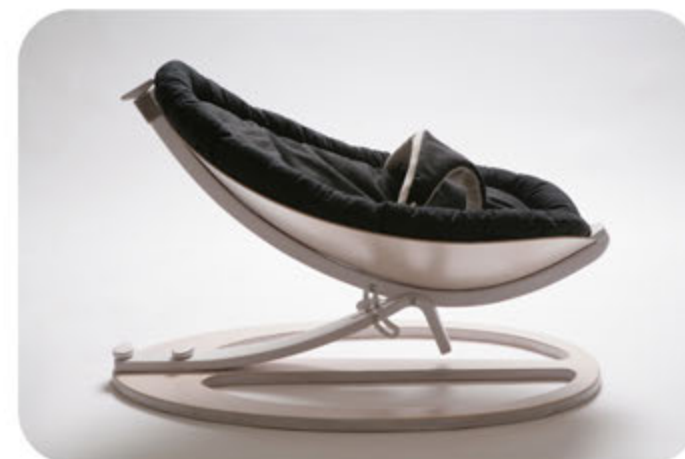
"Baby sitter" - sedačka