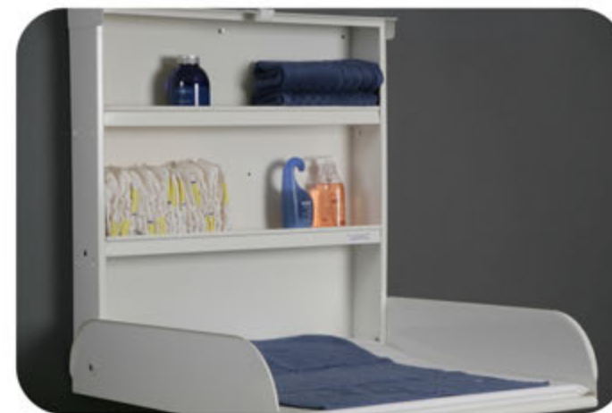
"Pippi" - plechový přebalovací pult