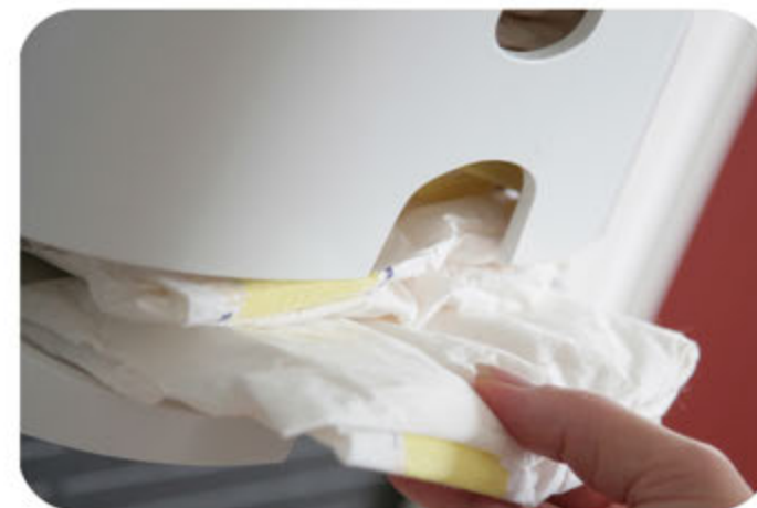
"Nappyrette" - zásobník na pleny